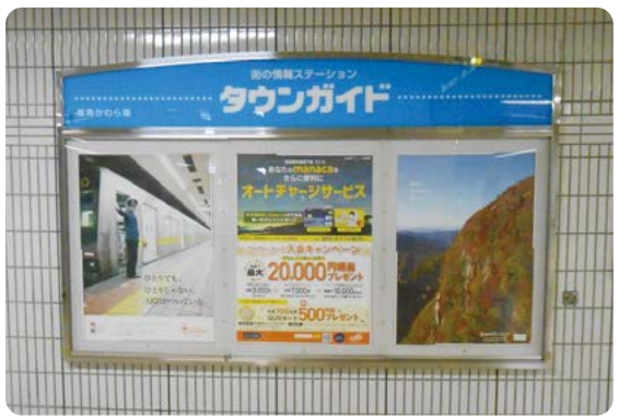
通常掲出イメージ

イベントやキャンペーンの告知など、短期間のプロモーションとしてご活用いただけます。掲出期間は1週間から効果的にご利用いただくことができます。