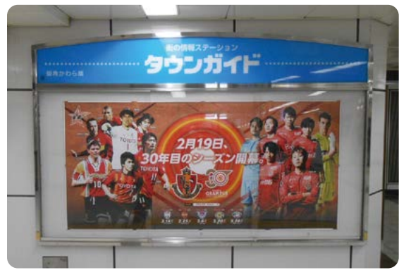
トリプルサイズも掲出可能